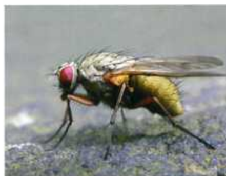
German Mega Circuit