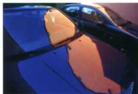
Farbe in Trier