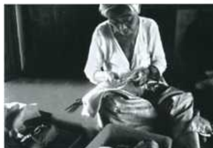
Auf Umwegen zur Menschenfotografie

Sie erreichen uns unter Tel.: (07142) 709823 E-Mail red.Sammellinse@gmx.de